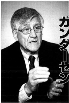
アーニー・ガンダーセン (原子力技術者)

福島第一原発事故の直後、CNNテレビで「すでにチエルノブイリと同じレベルだ」と指摘した米原子力技術者のアーニー・ガンダーセン氏。近著「福島第一原発——真相と展望」(集英社新書)で今後起こり得る危機について警鐘を鳴らした。「第二のフクシマ、日本滅亡」(朝日新書)で同様の警告を発した作家・広瀬隆氏との、先月の来日時に実現した緊急対談をお伝えする。